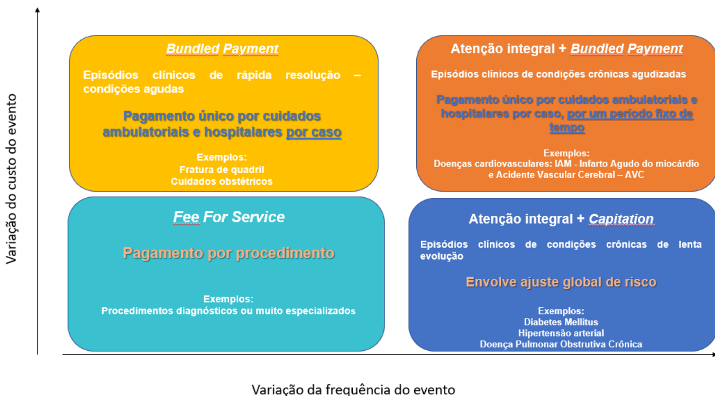
Figura 4 – Diferentes sistemas de pagamento equacionam diferentes problemas de custo e qualidade do cuidado em saúde:

Fonte: Adaptado de Center for Healthcare Quality and Payment Reform , em 2017 - http://www.chqpr.org/ Livre Tradução: Daniele Silveira – Especialista em Regulação - ANS